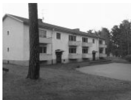
Masmästarvägen 6A & 6B

Förfriskningar: Alkoholservingstillstånd finns.