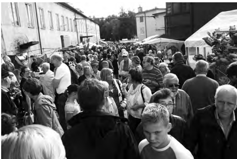
Trängsel. Det strålande vädret och invigningen av den nya skulpturparken drog många besökare till årets Bruksmarknad i Hälleforsnäs lördagen den 17 september.