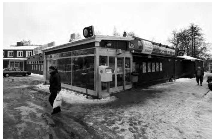
Ortens enda livsmedelsbutik. Coop Konsum i Hälleforsnäs går bra och kommer att finnas kvar på orten. Rånnet hotar inte butikens existens, om det nu var någon som trodde det. Personerna på bilden har inget samband med artikeln.