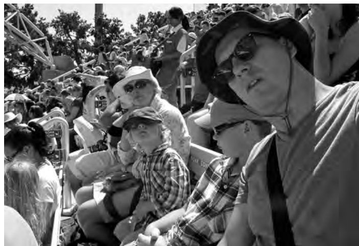
På familjeutflykt i San Diego. Familjen struntade i att titta på svenska tv-program via STV Play och umgicks inte med andra svenskar i området. I stället ville de umgås med lokalbefolkningen och bekanta sig med den amerikanska kulturen. "Vi ville göra saker vi inte kunde göra hemma i Sverige."