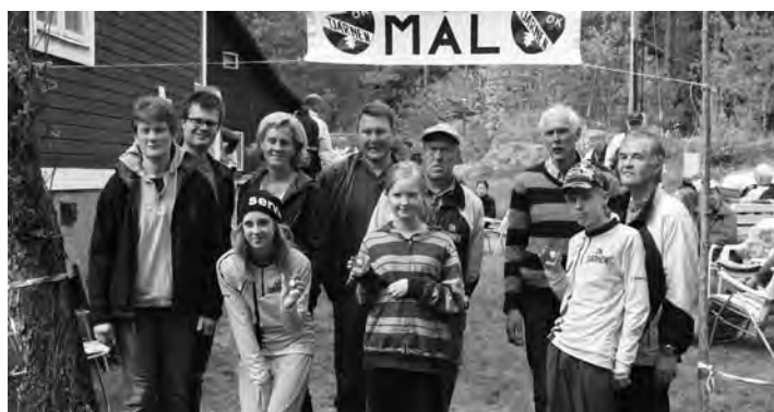
OK Tjärnen. De vinnande lagen av årets Gångkavlen med placeringar 1—3.