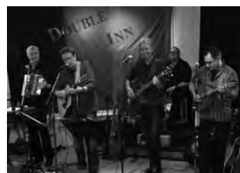
Double Inn, Kolhuset i Hälleforsnäs den 31 augusti

fre 31/8 Konsert Keltisk folkrock med Double Inn, Kolhuset Hälleforsnäs kl 19. Se annons på s. 3.