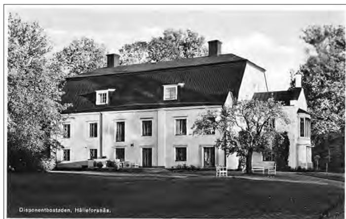
Disponentbostaden, Disponentvillan, Stora huset. Kärt barn har många namn. Byggnaden pryder en mängd gamla vykort, här ser vi ett som visar husets baksida. Framsidan med entrén vetter mot Bruket.

— Eftersom byggnaden är K-märkt måste arbetet genomföras på rätt sätt. En antikvarisk kontrollant från Sörmlands Museum har varit här flera gånger, vid planeringen och under renoveringen. Man ska inte kunna