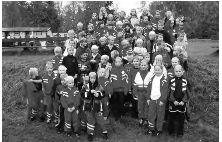
Fotbollsavslutning på Hagängens IP 2004. Mellösa IF har under decennier kunnat stoltsera med en mängd idrottsliga aktiviteter. Nu söker föreningen nytt folk för att kunna hålla föreningen vid liv.

engagemang i bygden som både har intresse och idéer hur Mellösa IF ska kunna leva vidare, skriver styrelsen och hoppas på ett stort engagemang och stor