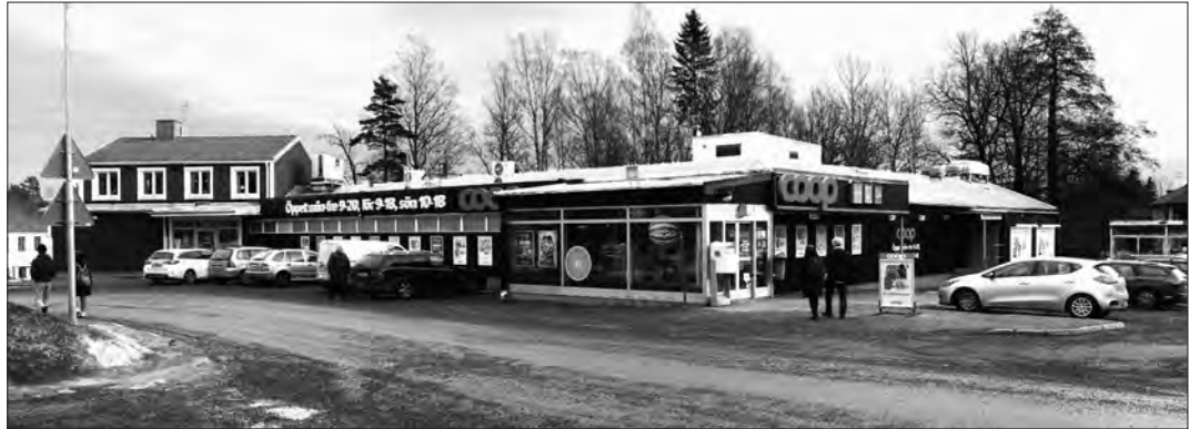
Fastigheten vid Celsings allé har genomgått en rejäl ansiktslyftning under vintern, både utvändigt och på insidan. Den har även fått nya hyresgäster (i den på bilden vänstra änden av byggnaden).