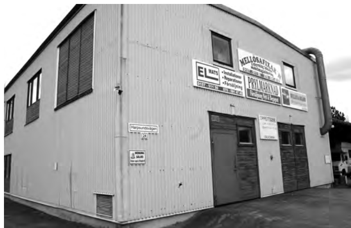
Många idéer: Skyltarna vid gaveln på den före detta industrilokalen vid Harpsundsvägen i Mellösa berättar om vad som händer innanför dess väggar. Ägarna av fastigheten nöjer sig inte med en idé utan har många järn i elden.