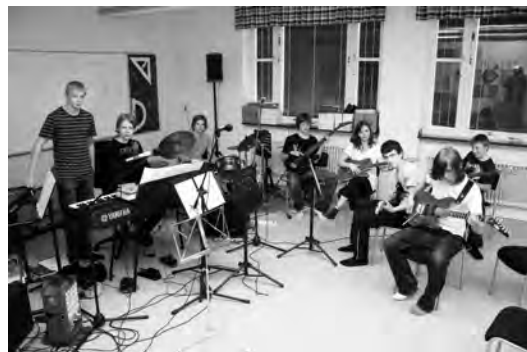
Musik- och ljudskapande. Orkestern har övat hela terminen inför premiären på Kolhuset i juni.