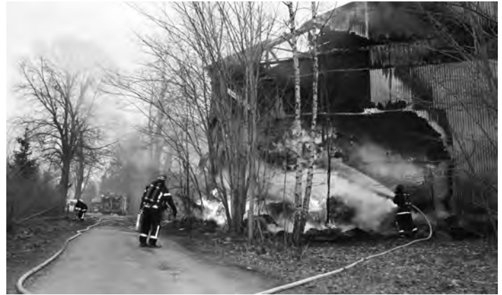
Plåtväggarna brändes sönder. Värmen från de brinnande halmbalarna brände sönder båda taket och väggarna inom några minuter. Balarna tillhörde en av traktens jordbrukare som hyrt en del av byggnaden.

Det var eftersläckningen som tog tid. Halmbalarna var tätt packade och när man sprutade vatten på balarna, rann vattnet bara av. Brandmännen jobbade sent in på natten med att frakta ut halmbalarna ut på gården, sprida ut dem och spruta vatten