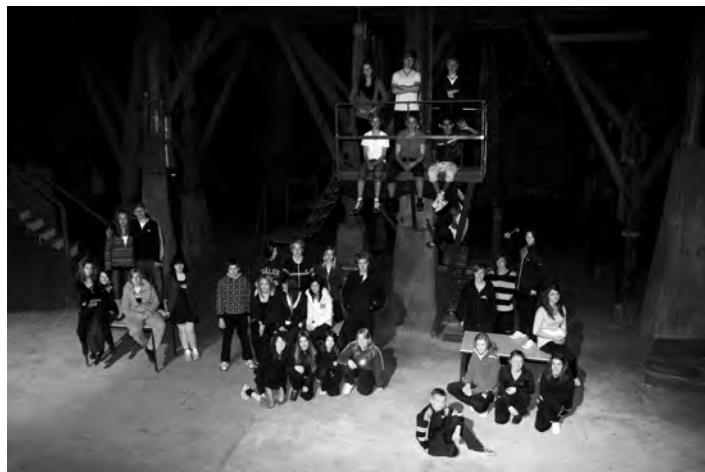
Kretsar kring järn. Skoleleverna skapar teater i Kolhuset. Föreställningen heter "Järnkoll, 350 år i Hälleforsnäs". Bruket har en central plats i pjäsen.