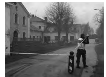
Avspärrat. Hela området mellan Hästskon (på bild) och Stora Vårdshuset, inklusive torget, spärrades av under släckningsarbetet.