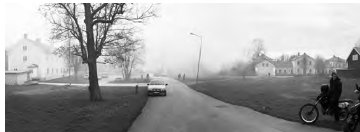
Mycket rök. Plåtbyggnaden som brann står där, mitt i bilden. Den syns bara inte för all rök. Räddningspersonalen kunde relativt lätt få branden under kontroll men eftersläckningsarbetet tog lång tid. Halmbalarna som hade fattat eld behövde öppnas och spridas ut innan de kunde släckas helt.