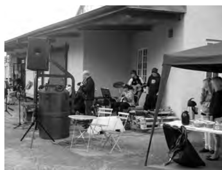
Ljud- och musikskapande.