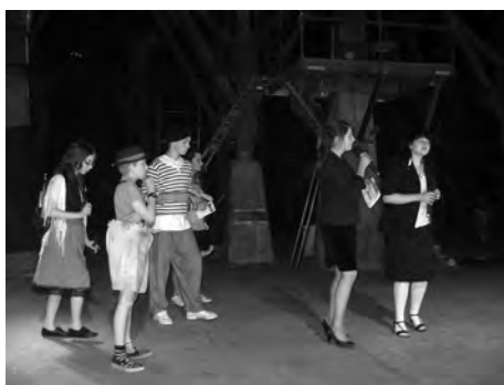
Turister på Bruket.

ANNE-LIE BRIBY BRUKSSKOLAN, HÄLLEFORSNÄS