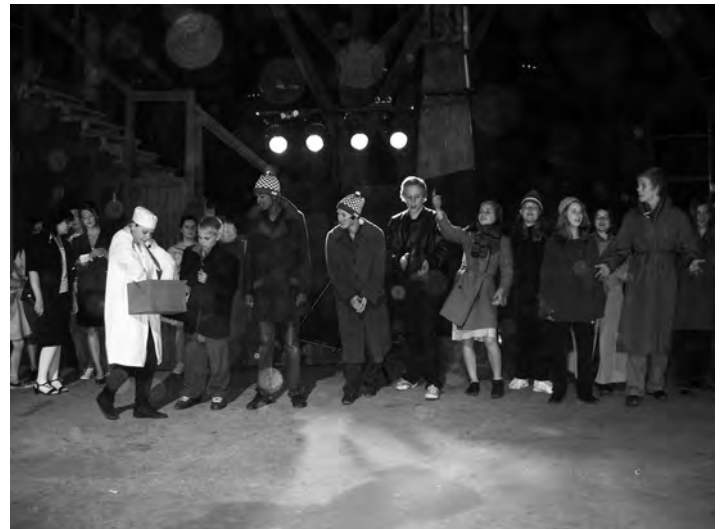
Bruket's Blå fanklubb. Bilderna på föreställningen "Järnkoll, 350 år i Hälforsnäs" togs av eleverna i Marknadsföringsgruppen.

Vi träffar på en massa smeknamn och små vardagliga händelser, vi får se den stora branden på bruket gestaltas genom dans, vi får vara med under en bandy-match på Edströmsvallen, se ett förstamajtag och höra om fackföreningen.