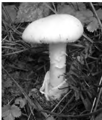
En sällsynt svamp. Ett av fynden under svampexpeditionen: en Gul kamskivling ( Amantia flavescens ).